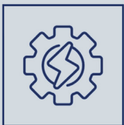
Gateway de Pagamer (Cartão, Boleto)

A maior praticidade e conveniência. Ao sinal de um toque.