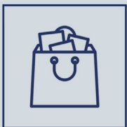
Ferramentas para Marketplace