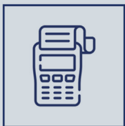
POS e Serviços de SubAdquirente