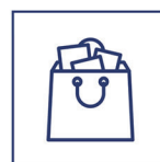
Ferramentas para Marketplace