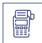
POS e Serviços de SubAdquirente