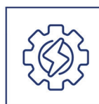
Gateway de Pagamento (Cartão, Boleto)

A maior praticidade e conveniência. Ao sinal de um toque.